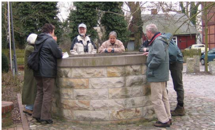
Wo ist die Hirschzunge? Selbst ein Brunnen - hier am Waldemarturm in Dannenberg - kann spannende Entdeckungen bereit halten.