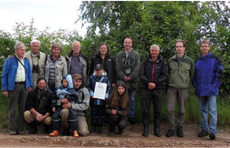
Mitglieder des Botanischen Arbeitskreises beim „Tag der Artenvielfalt“