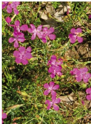
Die Heide-Nelke ist die Blume des Jahres 2012.