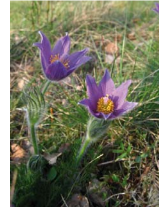
Küchenschelle in Kassau

18:45 Uhr Abschluss , Möglichkeit zum gemeinsamen Abendessen